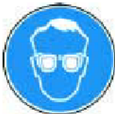
Príkaz na ochranu zraku