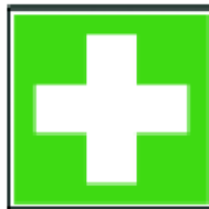
Miesto prvej pomoci