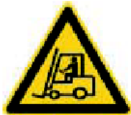
Nebezpečenstvo pohybujúcich sa priemyselných vozidiel