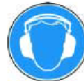
Príkaz na ochranu sluchu