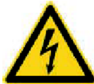
Nebezpečenstvo úrazu elektrickým prúdom