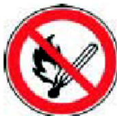
Zákaz fajčenia a používania otvoreného ohňa