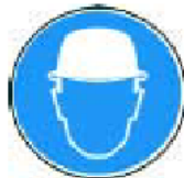
Príkaz na používanie ochranej prilby