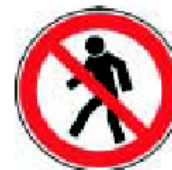
Zákaz vstupu pre chodcov